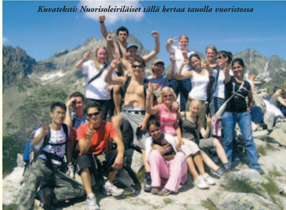
Kuvateksti: Nuorisoleiriläiset tällä kertaa tauolla vuoristossa

Osallistuminen Lionsien nuorisovaihto-ohjelmaan on unohtu-