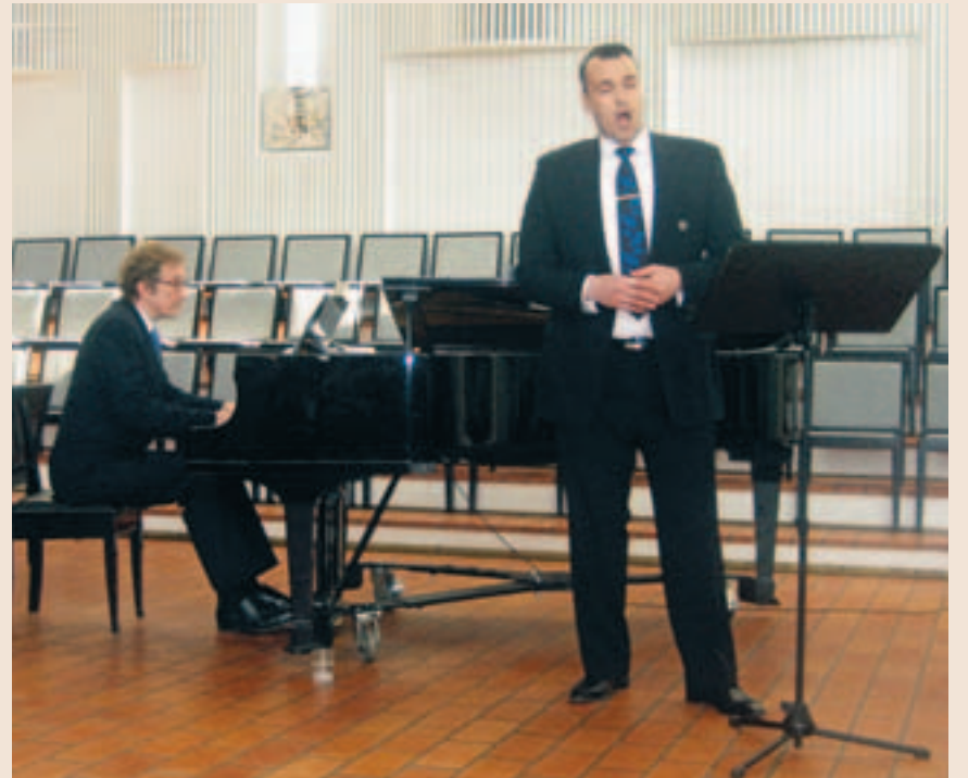
Olarin kirkkosali oli valoisa esiintymisympäristö