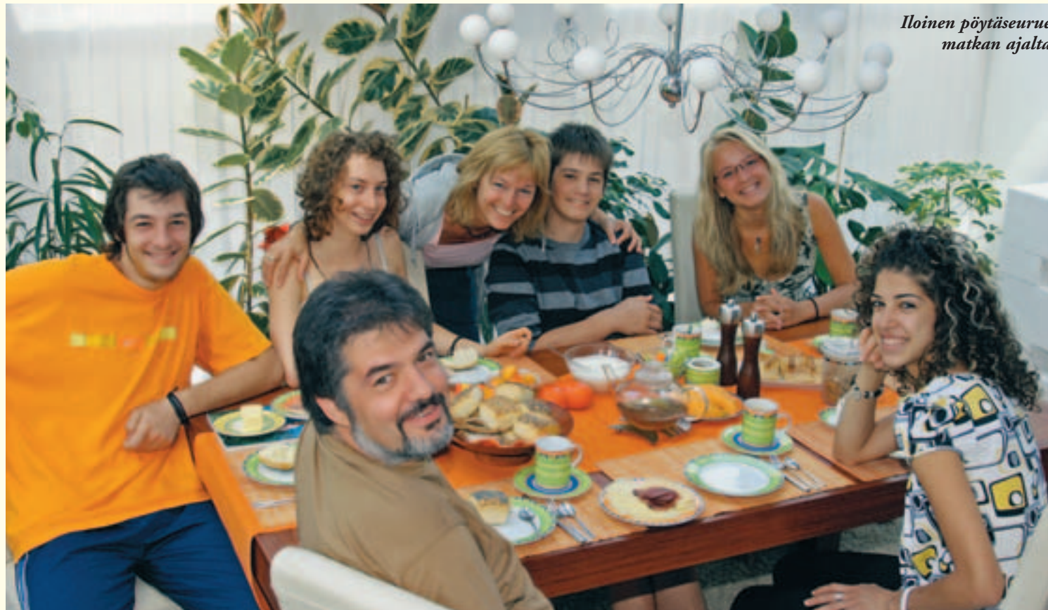
Iloinen pöytäseurue matkan ajalta

ryimme parissa tunnissa pienestä kyläyhteisöstä tilanteeseen, jossa me neljä tyttöä emme tunteneetkaan ketään muuta kuin toisemme. Ympäriimme pyöri nelikymmenpäinen lauma nuoria maailman joka kolkasta: Euroopasta, Etelä- ja Pohjois-Amerikasta, Aasiasta ja jopa Afrikasta. Vilkkaita keskusteluja riitti yhtä monella eri aksentilla kuin oli ihmisiäkin. Helpotukseksi englanti ei taaskaan osoittautunut ongelmaksi. Itse asiassa huomasin, että leirillä olevien kolmen suomalaisen kielitaito oli selvästi parhaimmista.