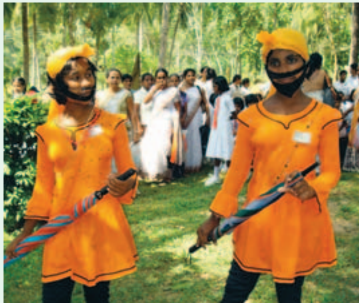
Lastenjuhlassa kummilapset esittävät monenlaista ohjelmaa. Suosituimpia ovat erilaiset tanssit ja kuvaelmat. Kaksi tyttöä esittää historiallista kuvaelmaa pukeutuneena asianmukaisesti historiallisiin asuihin.