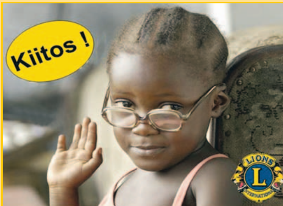
Lions-klubit lahjoittavat vuosittain 5000 000 kpl kierrätettyä silmälasia kehitysmaihin. Sight First -kampanjassa Suomen lionsklubit keräsivät 30 000 kpl silmälasia, jotka lahjoitettiin Sri Lankaan.

Edellisen näönsuojeluprojektin tuloksena palautettiin näkö 7,1 miljoonalle kaihipotilaalle, ehkäistiin 24 miljoonan henkilön vakava näön menetys. Tämän lisäksi projektin kautta annettiin yli 80 miljoonaa hoitokertaa jokisokeutta vastaan, tehtiin 125 000 trakoomaleikkausta ja annettiin 4,6 miljoonaa Zithromax-hoitoa trakoomaan.